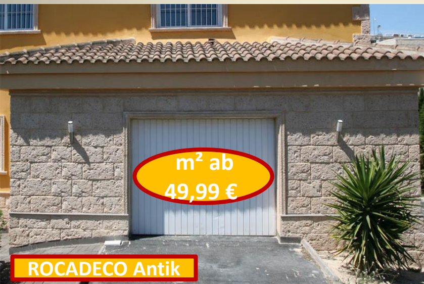
m 2 ab 49,99 €