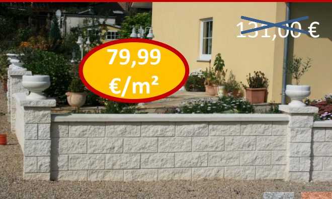
79,99 €/m 2