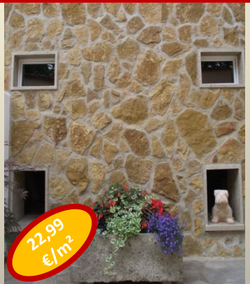
22,99 €/m 2