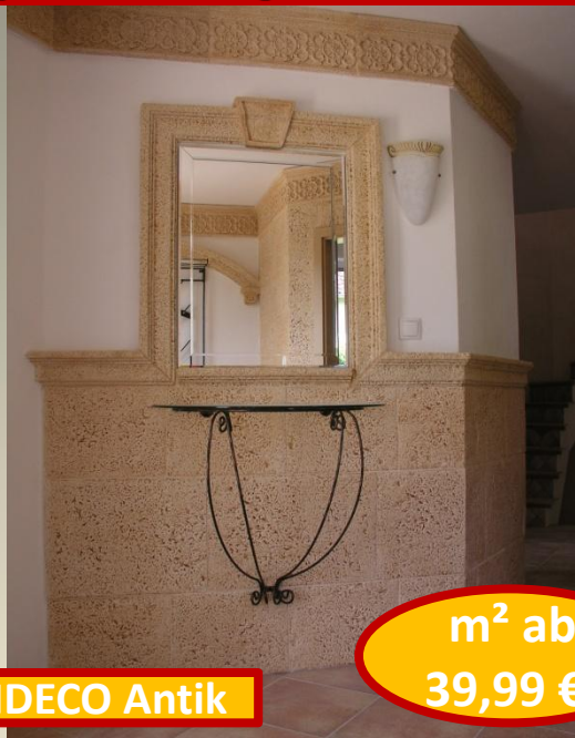
m 2 ab 39,99 €